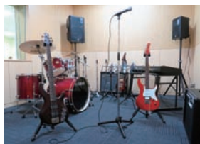
中高生用音楽スタジオ

レイルームで支援者が付き添いながら交流をしています。このうちの1組は、現在調停係属中で、次回期日までに面会交流の試行実施をする必要があったため、本市の制度を利用されました。一方、後者は、こどもが小学生などで、支援者が付き添うことなく交流を行っています。交流頻度は概ね1～2ヶ月に1回の割合で、最も多いケースは既