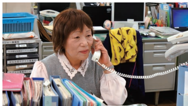
全国母子・父子自立支援員連絡協議会会長も務められたベテランの頼れる支援員さんです。