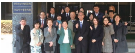
養育費履行管理院の正面玄関にて訪問団と同院幹部