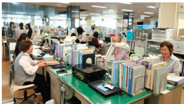
とても和やかな明るい職場

近年、若年離婚が増加。残念ながらよく話し合っただけではないような気がします。今後私たちには、当事者の声を国の施策につなげていく使命もあります。連絡協議会が全国組織だからこそやっていかなければならないと思うのです。司法の立場で当事者の声を聴いていらっしゃる養育費相談支援センターとも連携をとりながらひとり親家庭の支援をしていきたいと思えます。