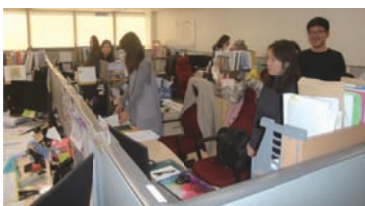
取立て部 養育費履行管理院 若手弁護士 20人

特に、取立て部執務室見学の際の説明によると、取立て部担当者は20人の若手弁護士（養育費履行管理院職員総数64名）を公募により採用し、彼らは子どもの未来を育てる職務への誇りと情熱をもつとコメントされ、それに応えるような担当者の輝く表情が印象的でした。