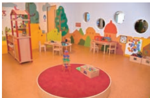
親子交流スペース

の新聞報道や国の動きからしますと、本市の取り決め支援策は一定の効果を上げているものと認識しています。