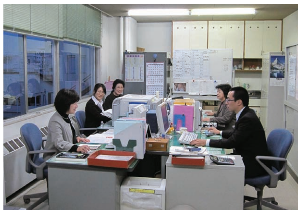
外は寒くてもいつも暖かい執務室