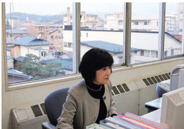
今日も窓から見える岩手山(上の写真)に励まされ♪

離婚ということに対して、何よりも子どもたちの心に影を落とさないよう、相談者がどのように歩み、どのような問題を抱えて、何を大切に、どうしたいと思っているのかを、相談者に寄り添い肯定的に物事を考えていけるようなきっかけを作り出せたら何よりです。今後も、あの岩手山を望みながら気持ちを整え、相談を受けていけたらと感じております。