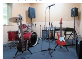
中高生用音楽スタジオ

レイルームで支援者が付き添いながら交流をしています。このうちの1組は、現在調停係属中で、次回期日までに面会交流の試行実施をする必要があったため、本市の制度を利用されました。一方、後者は、こどもが小学生などで、支援者が付き添うことなく交流を行っています。交流頻度は概ね1～2ヶ月に1回の割合で、最も多いケースは既